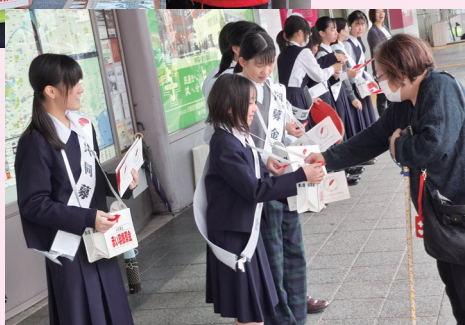
令和7年10月25日 信愛中学校の生徒会の 皆様が街頭募金を実施 (JR和歌山駅前)