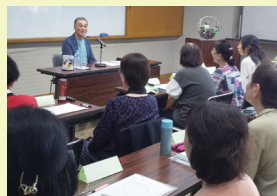
《元NHKアナウンサーによる指導風景》