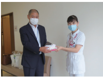
和歌山ろうさい病院

皆様からいただいたタオルで製作した「タオル帽子」は、各医療機関へ贈呈しています。