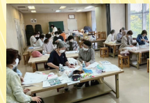
【ボランティアによる タオル帽子製作風景】

「タオル帽子」は、頭皮への刺激を少なくするため、すべて手縫いでの製作となります。 患者さんには「とても肌触りがいい」と喜んでいただいています。