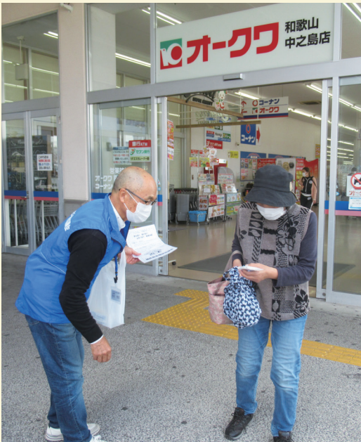
中之島地区において啓発