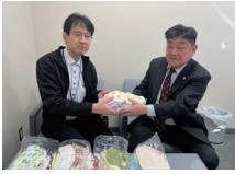
和歌山県立 医科大学付属病院