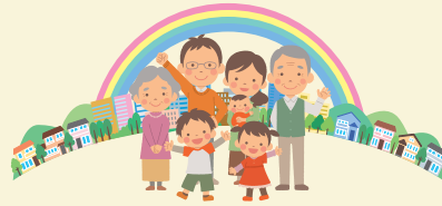
南海和歌山市駅前啓発

お住いの地域の取り組みについて「知りたい」「参加してみたい」という方はご遠慮なくお問い合わせください。