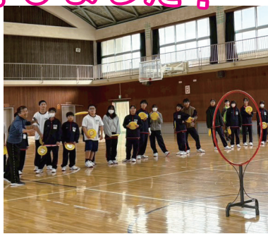
《障がい者スポーツ体験》 ～フライングディスク～