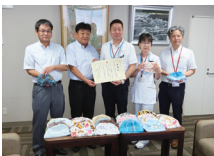
日本赤十字社 和歌山医療センター