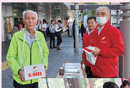
令和7年10月1日 街頭募金を実施 (JR和歌山駅前)

集まった募金は、地域で行われるボランティア活動や福祉活動、災害時の被災地支援などに役立てられます。皆様のご協力を賜りますようお願い申し上げます。