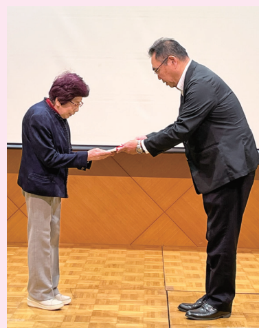
近畿労働金庫和歌山地区本部から当会に目録が授与されました。